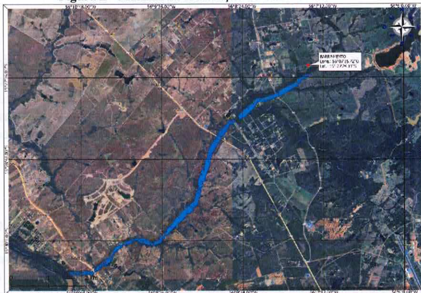
Figura 2 - Mancha de inundação da Fazenda SS Ranch